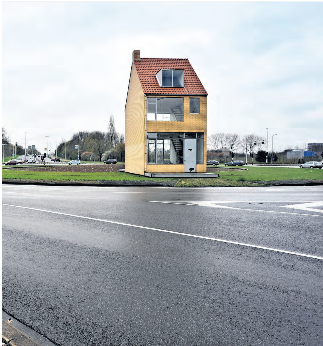
Het draaiend werk op een Tilburgse rotonde van kunstenaar John Körmeling.