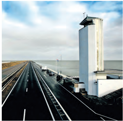
Afsluitdijk, de strijd tegen het water