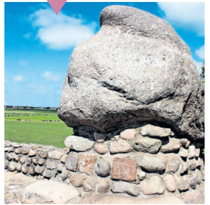
Monument in Warns