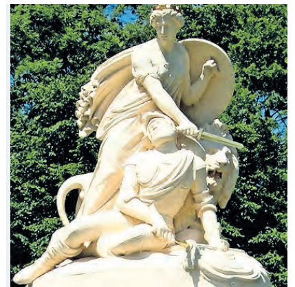
Monument voor de Slag bij Heiligerlee

V eel van wat de mens doet is vluchtig. Gelukkig maar. Dagelijkse wandelingen en ritjes heen en weer, oppervlakkige gesprekken en ontmoetingen, tandenpoetsen, slaap en toiletbezoek zijn basisbehoeftes die soms onverwachte resultaten opleveren, maar die niet allemaal apart in de geschiedenisboekjes hoeven. De meeste mensen krijgen een persoonlijk herinneringsmonument op de begraafplaats.